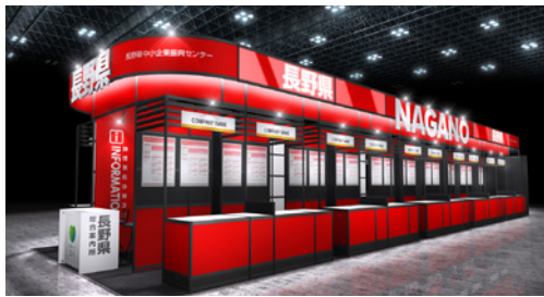
長野県ブース位置 (長野県中小企業振興センター) ブース番号 西2ホール W10-40