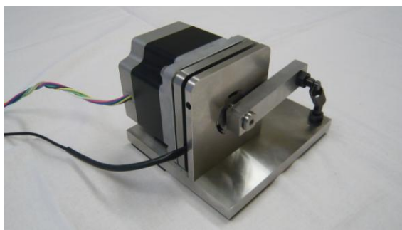
モータトルクセンサ