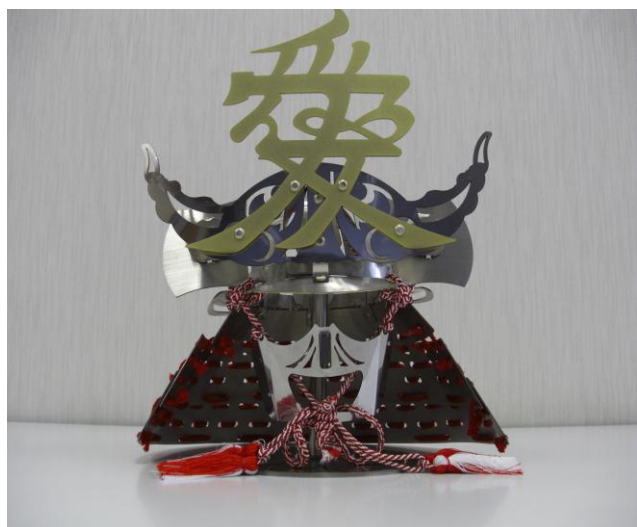
オリジナル製品（直江兼続兜）