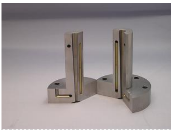
ハイサイクルスプルーブッシュ